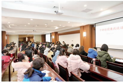
各项工作,为医院发展做出新的贡献。

新提拔的干部逐一作出廉政承诺,并表示在今后的工作中,恪尽职守、爱岗敬业,在学习、工作中坚持以身作则,廉洁奉公,决不辜负领导和同事对自己的信任和期望,带领科室人员积极做好